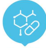
Stratejik Ar-Ge Proje Çağrısı

Proje Bütçesi D1 Grubu Projeler Üst Limit (50 Milyon ₺) D2 Grubu Projeler Üst Limit (70 Milyon ₺) D3 Grubu Projeler Üst Limit (80 Milyon ₺)