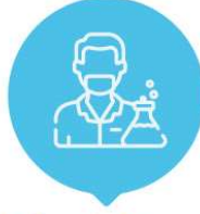
Yüksek Lisans Öğrencilerine Yönelik A2 Proje Destek Programı