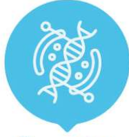
Öncelikli Ar-Ge Proje Çağrısı

Proje Bütçesi Küçük Ölçekli C1 (4.000.000 ₺) Orta Ölçekli C2 (6.000.000 ₺) Büyük Ölçekli C3 (7.900.000 ₺)