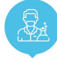
Doktora/Tıpta Uzmanlık Öğrencilerine Yönelik A3 Proje Destek Programı