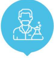
Lisans Öğrencilerine Yönelik A1 Proje Destek Programı