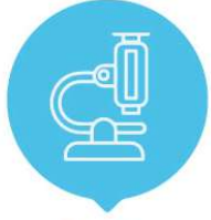
Ar-Ge Proje Çağrısı