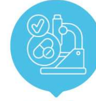
Klinik Araştırmalar Proje Çağrısı

Proje Bütçesi 100 Milyon ₺ (Başvuru öncesi TÜSEB'e bütçe sunumu yapılmalıdır.)